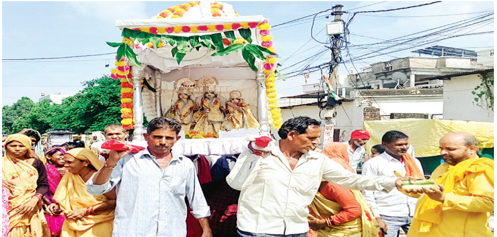
हरिभूमि न्यूज़ | ललितपुर

सनातन धर्म की प्राचीन परम्पराओं के अनुसार जलविहार पर्व आज जनपद में अगाध श्रद्धा व उत्साह के साथ मनाया गया। इस अवसर पर नगर में विमानों की भव्य शोभा यात्रा निकाली गई तथा सुम्मेरा तालाब पर श्रीजी का जलाभिषेक किया गया। गौरतलब है कि इस वर्ष सुम्मेरा तालाब को जिला प्रशासन व नगर पालिका परिषद ने अत्याधुनिक व आकर्षक तरीके से सजाया था। फलस्वरूप घाटों पर इस बार के जल विहार ऐतिहासिकता बिखरता गया। नौकाओं में श्रीजी को सवार कर जल विहार कराया गया। विमानों के दर्शनार्थ श्रद्धालुओं का सैलाब उमड़ पड़ा था। जल विहार पर्व को लेकर आज सुबह से ही सभी देवालयों में धार्मिक कार्यक्रम शुरू हो गए थे। प्राचीन काल से चली आ रही परम्परा के अनुसार अपराह्न मोहल्ला चौबयाना स्थित श्रीरघुनाथजी बड़ा मन्दिर से सबसे पहले विमानों की शोभा यात्रा निकाली गई। इस शोभा यात्रा में शामिल हो गए। तत्पश्चात रावरपुरा, महावरीपुरा, घंटाघर, सावरकर चौक पर अन्य देवालयों से आये विमानों का मिलन हुआ। रावरपुरा में विमानों का सम्मिलन होने के पश्चात इस ऐतिहासिक शोभा यात्रा ने वृहद रूप धारण कर लिया। गाजे बाजे व शंख