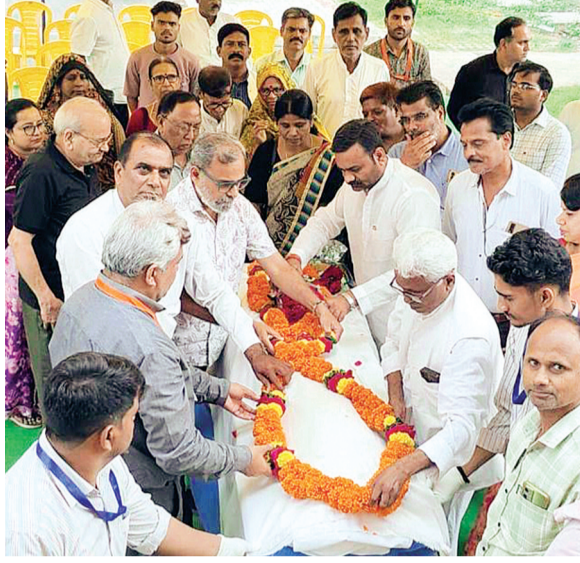
हरिभूमि न्यूज़ | ललितपुर

शान्ति देहदान चौरिटेबल ट्रस्ट ने कराया पुण्य कार्य