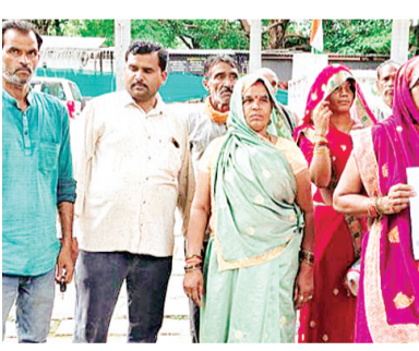
हरिभूमि न्यूज़ | ललितपुर

ब्लाक जखौरा अंतर्गत ग्राम पंचायत खड़ेरा व भैंसाई में रहने वाले किसानों ने जिलाधिकारी को एक शिकायती पत्र देते हुये गोवंश योजना के तहत पाली गयी गोवृंशों के भरण-पोषण के लिए अनुदान राशि दिलाये जाने की मांग